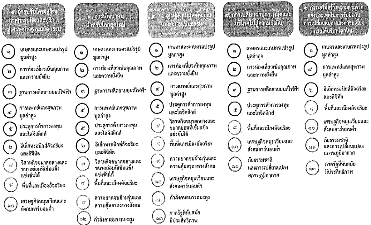
แผนภาพที่ ๓.๑ ความเชื่อมโยงระหว่างหมวดหมู่การพัฒนาที่เป้าหมายหลัก

ความเชื่อมโยงระหว่างหมวดหมู่การพัฒนาที่เป้าหมายหลักแสดงไว้ในแผนภาพที่ ๓.๑ โดยหมวดหมู่การพัฒนาที่กำหนดขึ้นเป็นประเด็นที่มีลักษณะเชิงบูรณาการที่ครอบคลุมการพัฒนาตั้งแต่ในระดับต้นน้ำจนถึงปลายน้ำ และสามารถนำไปสู่ผลพัฒนาทั้งในมิติเศรษฐกิจ สังคม ทรัพยากรธรรมชาติและสิ่งแวดล้อมไปพร้อมๆ กัน ทำให้หมวดหมู่แต่ละประการสามารถสนับสนุนเป้าหมายหลักได้มากกว่าหนึ่งข้อ นอกจากนี้การพัฒนากายใต้แต่ละหมวดหมู่ไม่ได้แยกขาดจากกัน แต่มีการสนับสนุนหรือเอื้อประโยชน์ซึ่งกันและกัน